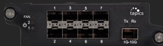
Jumper SP pour 8 ports de SPAN